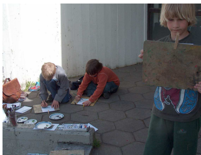
Nemendur í útitakennslu

Skeiða- og Gnúpverjahreppi, febrúar 2006