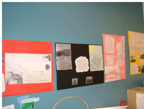
Veggspjöld með orkuverkefnum

Sorpstöð Suðurlands flokkar ekki pappír í marga flokka þannig að við höfum valið að flokka pappírinn í skólastofunum í tvennt. Annars vegar fullnýttan pappír sem búið er að skrifa á báðu megin og hins vegar pappír sem aðeins hefur verið notaður öðru megin og vel er hægt að nota fyrir minnismiða, krassblöð og teikningar. Í hverri stofu eru tveir kassar fyrir þessa flokka. Á kössunum eru leiðbeiningar um hvað er í hverjum þeirra. Einnig hefur kennurum verið gert að ljósrita báðu megin á blöð svo fremi sem það er framkvæmanlegt. Flokkun ferna fara aðallega fram í eldhúsum skólanna, þar sem nemendur fá mjólk í glasi til að drekka með morgunhressingunni.