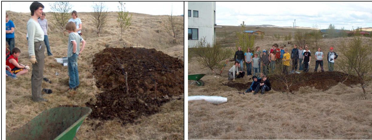
Bolette og nemendur að undirbúa beðið til þess að rækta kartöflur í.

Þar sem nýi vefurinn Heimurinn minn var tekin í notkun nú í byrjun árs 2006 verður hann notaður til kennslu í umhverfismennt í öllum bekkjum Þjórsárskóla á vorönn. Við fögnum þessu nýja efni og okkur finnst það falla vel að okkar vinnu.